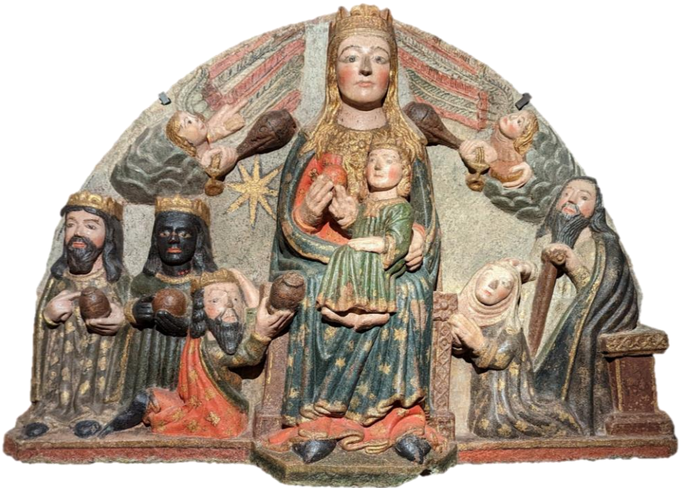
Anbetung der Könige / Granit / 14. Jhd. / Kathedraalmuseum Santiago de Compostela